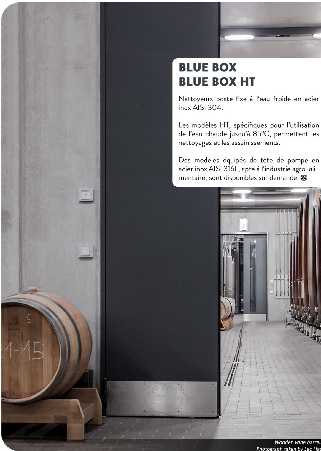
Wooden wine barrels.