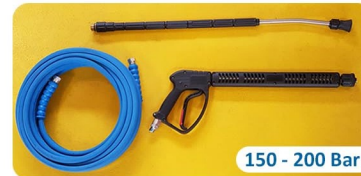
150 - 200 Bar

Standard : • Flexible haute pression antitache de 15m. • Pistolet avec partie fixe. • Lance. • Buse haute pression.