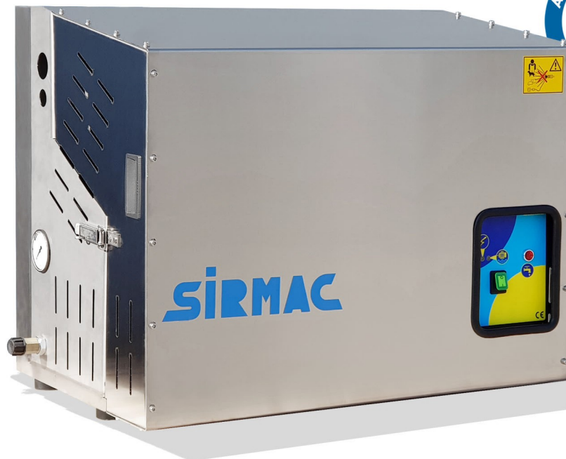
BLUE BOX BLUE BOX HT